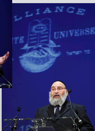
Lors la journée "Généralités Alliance", 2010.