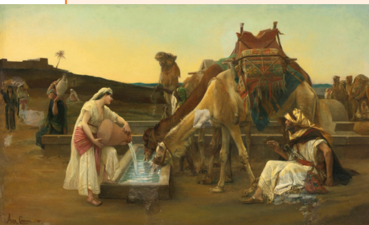
Rebecca et Eliezer, huile sur toile, Alexandre Cabanel, 1883.

Abraham, le père d'Isaac, avait une très grande confiance en D. en raison de la promesse qui lui avait été faite d'avoir une nombreuse descendance. C'est ainsi que l'on peut comprendre le moment de « la ligature d'Isaac » au cours duquel un bélier a été sacrifié en lieu et place d'Isaac. Puis Sarah mourut et Abraham la fit enterrer dans le Caveau de Ma'hpélah à Hebron.