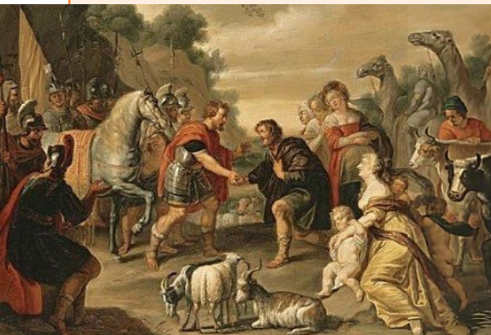
Réconciliation de Jacob et Esaü, huile sur toile, Abraham Willemsens, 17 e s.

5. Qui a obtenu la bénédiction du fils premier-né ?