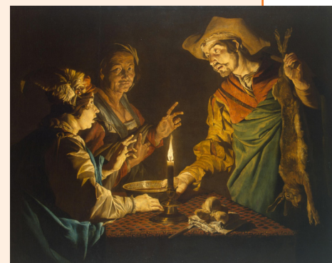
Esaü vend son droit d'aînesse à Jacob, Matthias Stom, 17 e s.

En effet, les deux frères étaient bien différents : Esaü, le premier-né, était fort, velu et aimait la chasse, tandis que Jacob était plus doux et sage et restait plutôt sous sa tente.