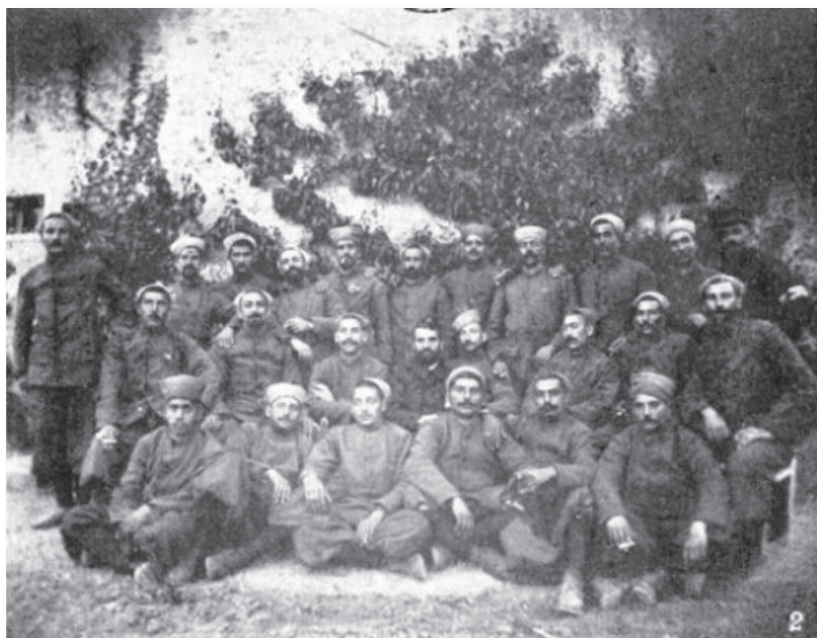
Soldats juifs dans l'armée française, originaires d'Algérie, appartenant à un régiment de zouaves qui ont participé, en 1916, à un seder organisé à Tracy (Champagne).

La bibliothèque de l'Alliance israélite universelle bénéficie du soutien de la Fondation pour la Mémoire de la Shoah, de la Mairie de Paris, de la Rothschild Foundation Hanadiv Europe, de la Fondation Nahmias, de la famille Carvallo.